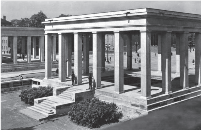
Слика 2 Паул Лудвиг Трост, Пантеон славе, Краљевски трг, Минхен, 1935

Полагањем права на класично градитељско наслеђе и њену културу, али и повлачењем паралела са властитом националном прошлошћу, као легитимним наследником класичних тековина, нова немачка архитектура градила је нове конструкте једне непостојеће традиције и тако творила „Нову традицију”. Међутим, то није била она изворна и природна традиција, пошто је била лишена свог основног елемента, а то је стваралачка слобода. „Нова традиција” није познавала и уважавала креативни потенцијал градитеља и њихову ауторску особеност, јер је сматрано да је „... архитекта овде био само посредник између воље и идеала”. 13 Уместо тога, ова архитектура се определила за друштвени колективитет, фокусирајући се на јавном карактеру грађевине, њеној поруци, намени и пропагандној улози, која је своју материјализацију имала у тотализујућој естетици хибридних монументалнистичких грађевина, где је монументално доведено до апсурда, и које су своју идеју црпље из дубоког убеђења у изворност класичног наслеђа и животност ове архитектуре. Оцењено је да „... жива архитектонска уметност Немачке јесте једна врста израза државне моћи...”, која је као и у „... свима великим историјским епохама ... у тесној вези са моћи земље, њеним законима, рангом и достојанством”. 14 Међутим, она није имала негативну друштвену рецепцију од стране савременика, и сматрано је да „... својим особинама и својим тежњама архитектонска уметност ... унапред одређена да видно полаже необориву политичку вољу”, и у