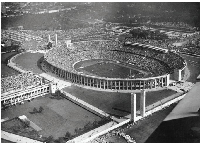
Слика 3 Вернер Марх, Олимпијски стадион , Берлин, 1936; извор илустрације: https://www.theguardian.com

повезани са њим, јер им тада изгледа да су ништавни и смрвљени огромношћу масе мртве материје. Нова немачка архитектура успела је на један чаробан начин да учесницима у тим великим техничким објектима појача снагу и веру у себе зато што се осећају органски повезани за њих, те са њима заједно живе и делају.” 19 (слика 3)